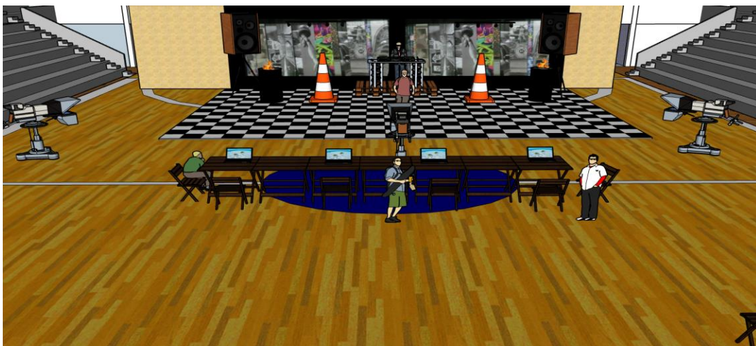
Imagem 1: Visão frontal em 3D do espaço do evento. 2020